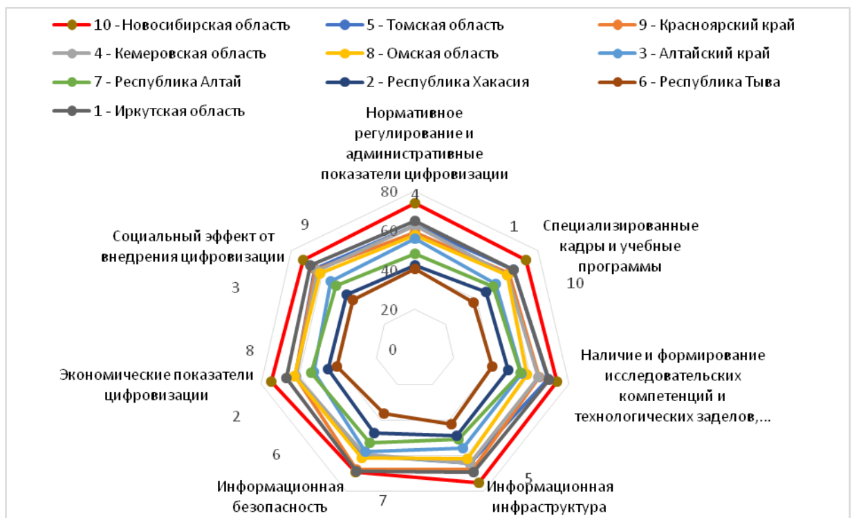
Рис. 3. Диаграмма показателей цифрового развития субъектов Сибирского федерального округа за 2018 г.

га — г. Москву. Однако для укрепления позиций и поднятия в рейтинге необходимо наращивать специализированные кадры и расширять учебные программы в области цифровой экономики, а также усиливать информационную безопасность. Аналогичным образом рассмотрен Сибирский федеральный округ по показателям индекса «Цифровая Россия» и построена радар-диаграмма [11] (рис. 3).